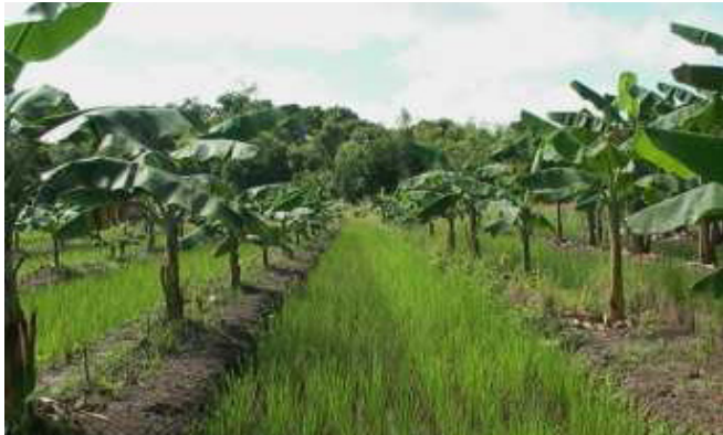
Sistem pertanian Surjan di lahan gambut.

Pengetahuan tradisional lainnya yaitu sistem pertanian Surjan, merupakan praktik khas masyarakat lahan gambut yang mengombinasikan sawah dan tegalan untuk memanfaatkan lahan secara multiguna. Pola ini memungkinkan petani menanam beragam komoditas, meningkatkan pendapatan, serta mengurangi risiko gagal panen melalui diversifikasi. Dengan pengelolaan lahan dan air yang efisien, sistem surjan juga berperan penting dalam memperkuat ketahanan pangan masyarakat.