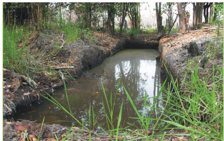
Kolam beje yang dikembangkan di lahan gambut Kalimantan.

mengembangkan kolam ikan tradisional di lahan gambut yang disebut “beje”, berfungsi tidak hanya untuk budi daya ikan tetapi juga sebagai sekat bakar untuk mencegah penyebaran kebakaran lahan gambut.