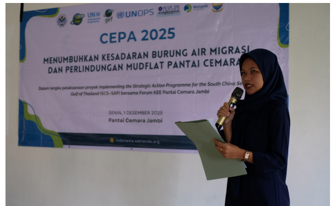
Perwakilan kelompok PKK Desa Sungai Cemara menyampaikan aspirasinya pada sesi diskusi mengenai pengelolaan potensi wisata berbasis burung bermigrasi

Masyarakat mengusulkan pembangunan infrastruktur pendukung seperti jalan, homestay, dan menara pengamatan burung. Mereka juga menyarankan pembentukan kelompok masyarakat dan peraturan desa yang fokus pada perlindungan burung migrasi. Dukungan datang dari kelompok ibu-ibu PKK yang siap mengembangkan produk oleh-oleh berbahan mangrove, seperti keripik jeruju dan agar-agar.