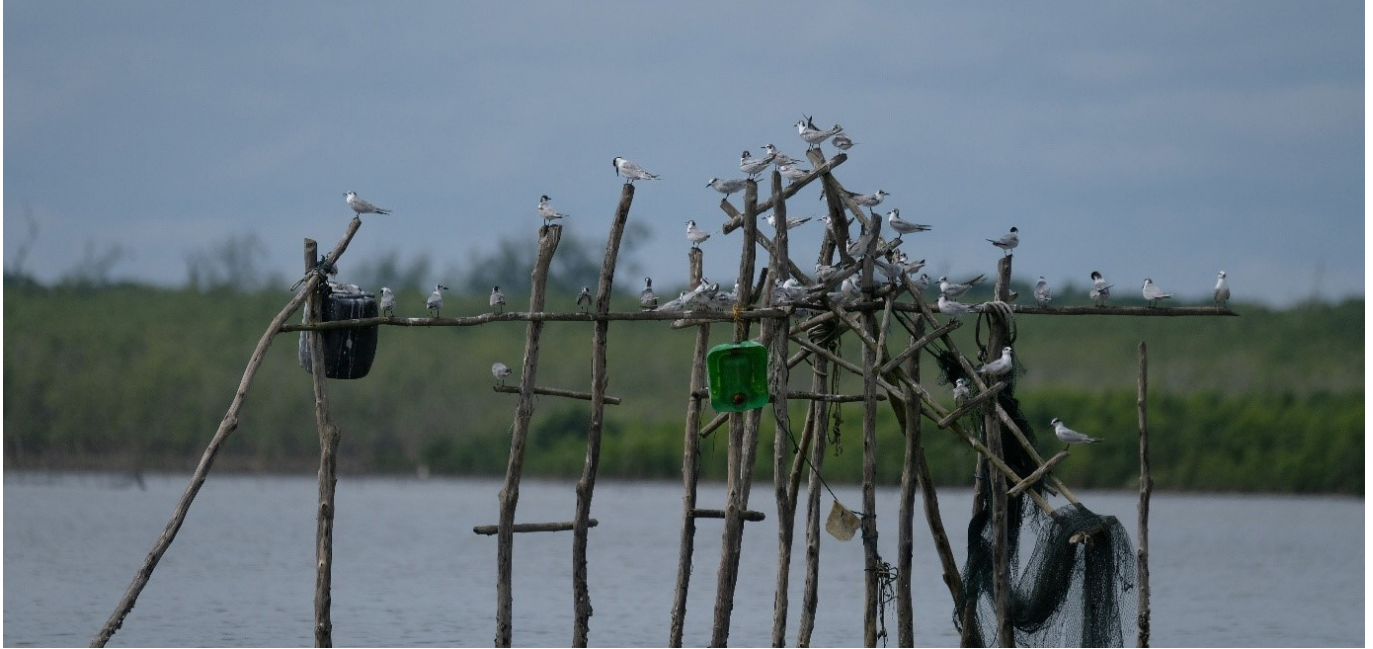
Burung air bermigrasi masih banyak terlihat di KEE Pantai Cemara, Jambi.

Pembangunan berkelanjutan harus berjalan seiring dengan pelestarian lingkungan. Prinsip ini menjadi dasar pelaksanaan kegiatan CEPA ( Communication, Education, Participation, and Awareness-raising ) di Desa Sungai Cemara, Kabupaten Tanjung Jabung Timur, Jambi, yang difasilitasi oleh Wetlands International Indonesia pada Senin, 1 Desember 2025. Desa ini merupakan anggota Forum Kawasan Ekosistem Esensial (KEE) Pantai Cemara dan berperan penting dalam pengelolaan dan pelestarian kawasan tersebut.