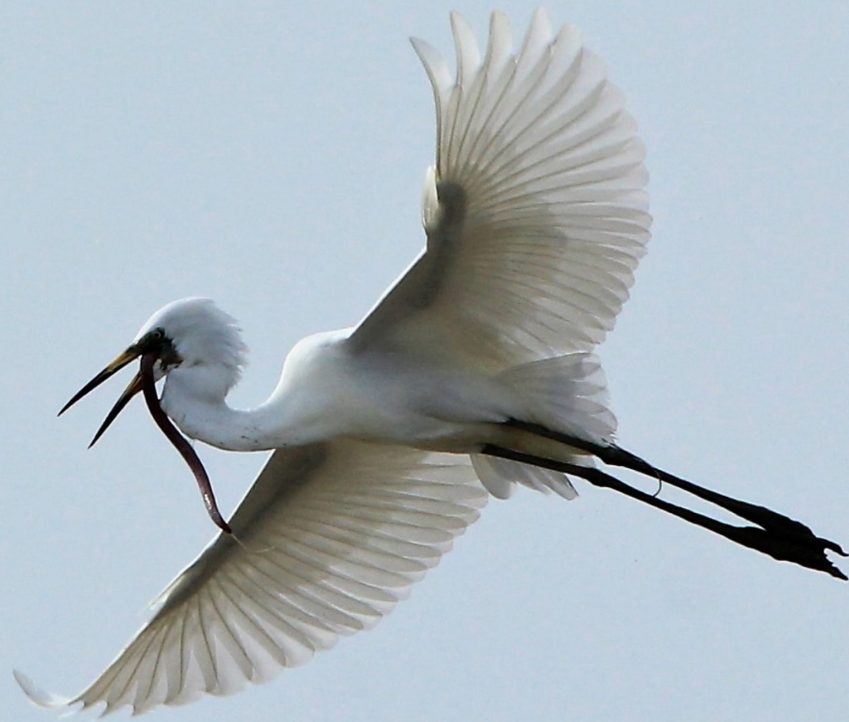
Kuntul kecil ( Egretta garzetta )

Biarkan mereka bebas dan terlihat indah di alam.