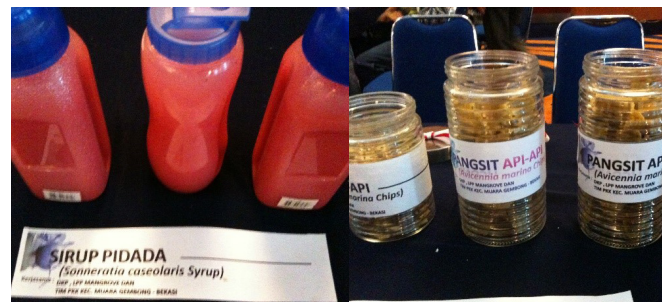
Produk olahan sirup (kiri) dan pangsit (kanan) berbahan dasar mangrove.

Praktik silvofishery —gabungan budidaya perikanan dan konservasi mangrove—berasal dari kearifan lokal yang memahami hubungan erat antara kesehatan mangrove dan produktivitas perikanan. Pengetahuan ini menunjukkan bahwa ekosistem mangrove yang terjaga mampu mendukung hasil ikan dan udang yang melimpah.