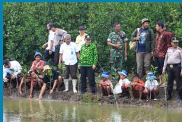
Penanaman mangrove bersama oleh para pejabat dan seluruh peserta