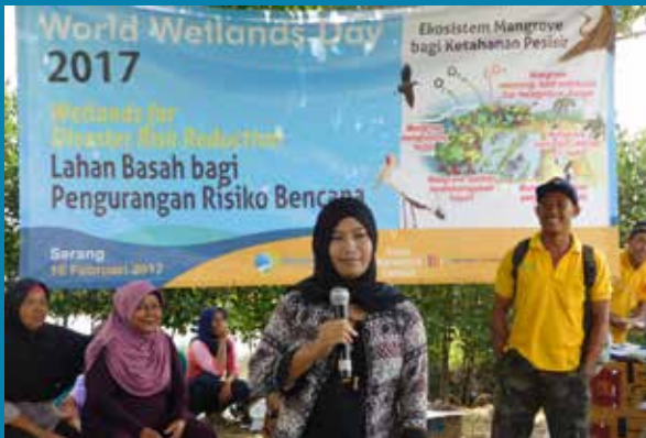
Presentasi pengembangan perekonomian yang dilakukan oleh kaum ibu-ibu