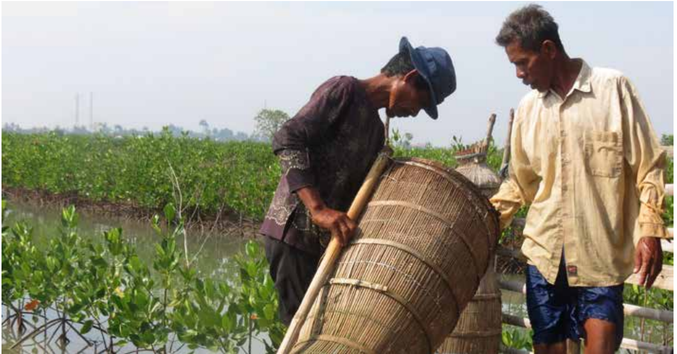
Rehabilitasi tambak dan pengembangan budidaya ikan tambak dilakukan secara sinergis, merupakan upaya penguatan kembali ekosistem pesisir yang rentan dari bencana serta peningkatan perekonomian masyarakat

Dengan bekerja bersama masyarakat setempat, dalam beberapa tahun terakhir, WII menerapkan pendekatan pengelolaan risiko terpadu untuk meningkatkan ketahanan masyarakat setempat terhadap bencana, yakni melalui pembangunan pemangkap lumpur yang dibuat dari bahan-bahan setempat, penanaman mangrove di pematang tambak (silvofishery), pengembangan ekonomi masyarakat dan pengarusutamaan prinsip-prinsip pengelolaan resiko terpadu kedalam kebijakan pemerintah setempat. Saat ini, berangsur-angsur abrasi dapat dikurangi dan lapisan tanah timbul sudah terbentuk dan ditumbuhi oleh barisan mangrove yang cukup rapat.