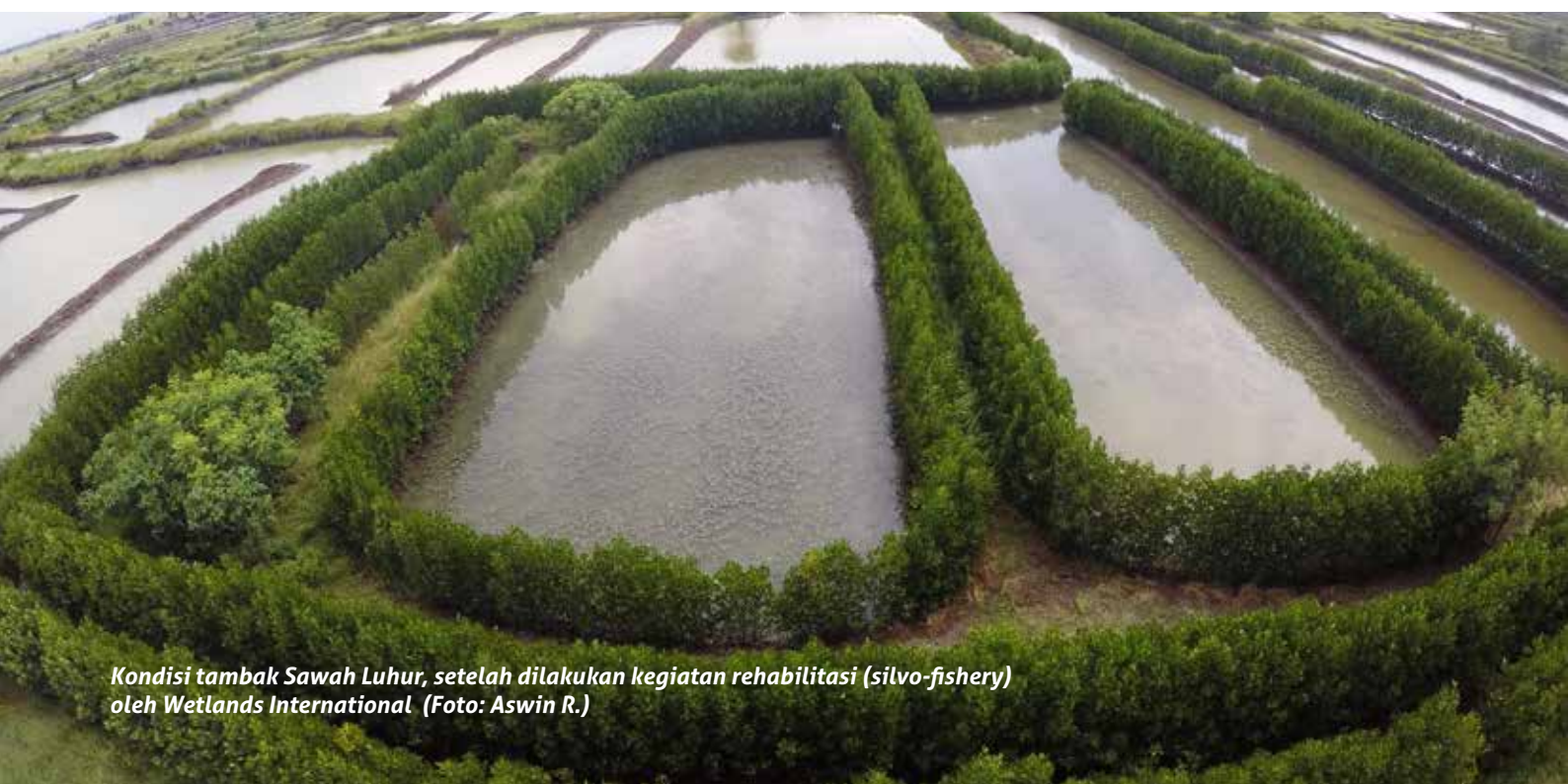
Kondisi tambak Sawah Luhur, setelah dilakukan kegiatan rehabilitasi (silvo-fishery) oleh Wetlands International

Dengan segala keterbatasan yang dimiliki, WII terus berupaya memperkuat seluruh program/kegiatan yang saat ini sedang dan terus berlangsung di pesisir Sawah Luhur, melalui kegiatan advokasi kebijakan bagi seluruh jejaring terutama bagi para pemangku kebijakan. ••