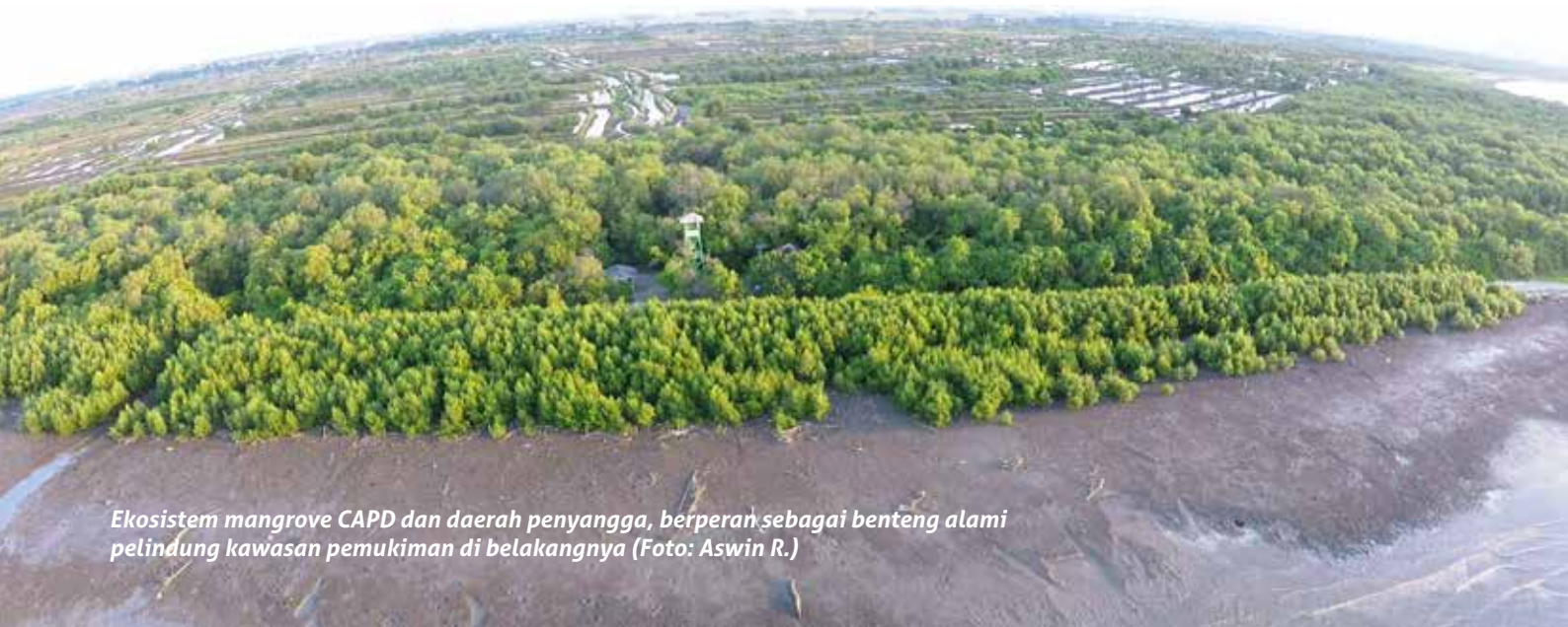
Ekosistem mangrove CAPD dan daerah penyangga, berperan sebagai benteng alami pelindung kawasan pemukiman di belakangnya