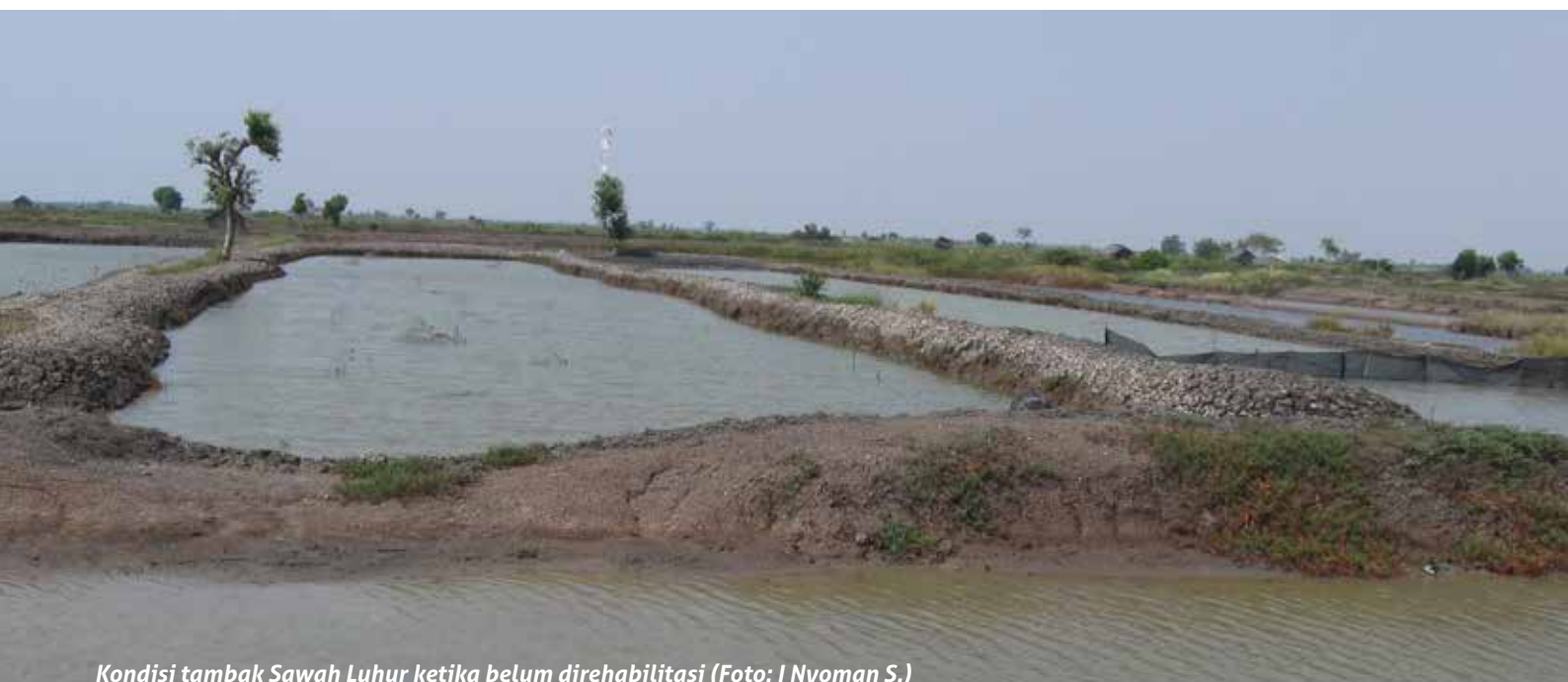
Kondisi tambak Sawah Luhur ketika belum direhabilitasi

Pada tahun 2001, WII memperkenalkan dan menerapkan program terpadu antara rehabilitasi kawasan pesisir Sawah Luhur dengan pengembangan perekonomian masyarakat dan penguatan kapasitas sumber daya manusia bagi masyarakat (petambak) sekitar. Kegiatan terpadu tersebut, hingga saat ini masih aktif dilakukan di pesisir Sawah Luhur. Untuk mendukung keberhasilan program, pada saat itu dibentuk kelompok perwakilan masyarakat dengan wadah yang diberi nama Kelompok Pecinta Alam Pesisir Pulau Dua (KPAPPD). Kelompok menjadi pelaku utama di dalam kegiatan rehabilitasi pesisir mereka, mulai dari perencanaan, penanaman mangrove di bibir pantai dan di pertambakan ( silvo-fihersy ), hingga pemeliharaan tanaman. Sebagai kompensasi, kelompok diberikan dana bantuan hibah untuk mengembangkan perekonomian mereka (bio-rights), saat ini dana hibah dikelola melalui usaha budidaya ikan bandeng.