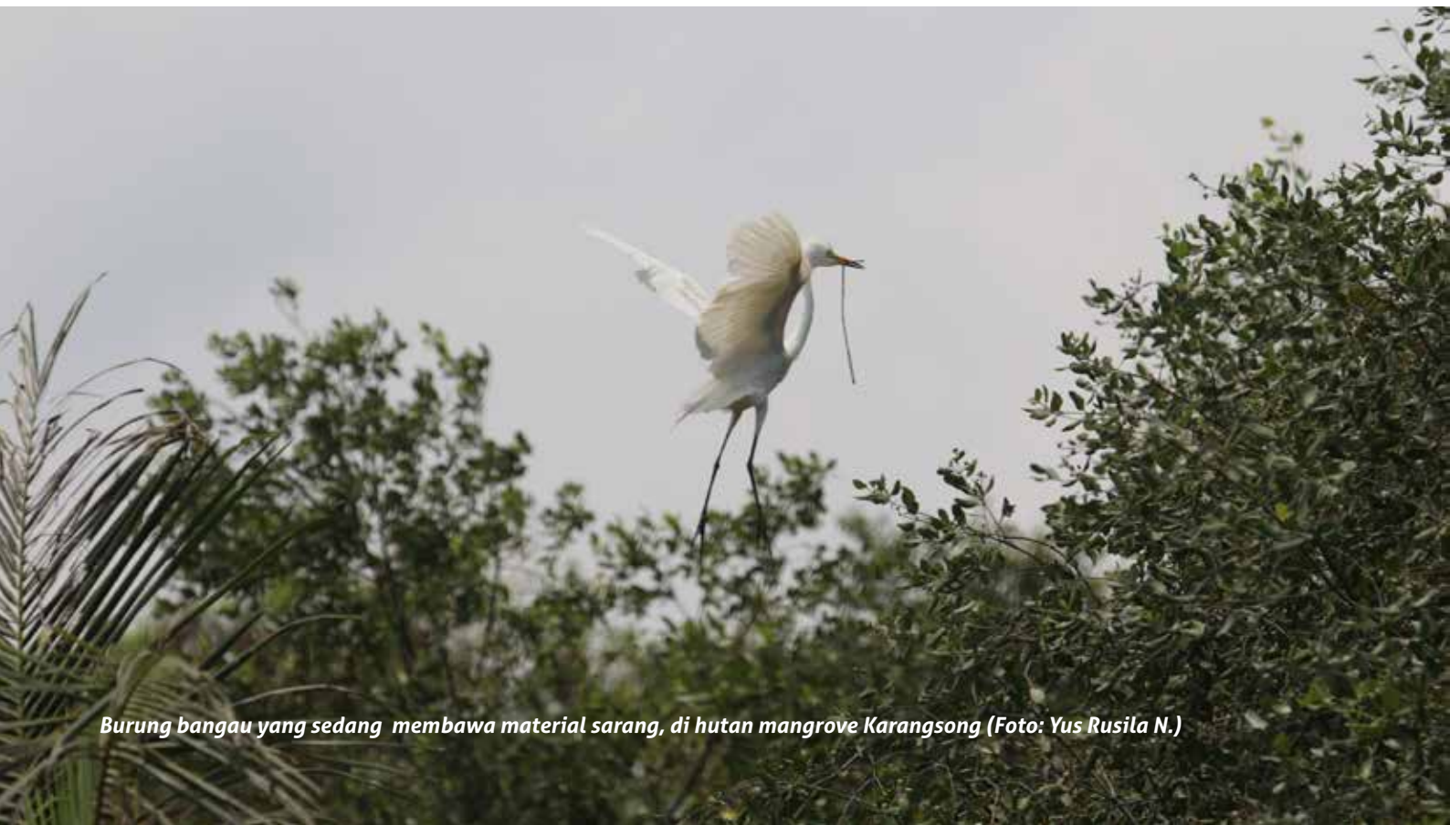
Burung bangau yang sedang membawa material sarang, di hutan mangrove Karangsong

Kegiatan pemantauan yang lebih terkoordinasi juga memberikan mekanisme penting bagi pengumpulan informasi penghitungan burung air serta prioritas konservasi, yang kemudian akan dilaporkan oleh