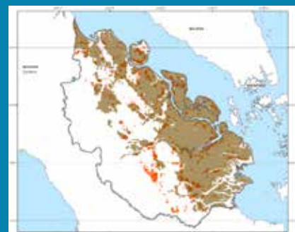
Luas dan lokasi kebakaran gambut di Riau, Sumatra, Indonesia (titik merah menunjukkan kebakaran gambut aktif) masing-masing untuk tahun 2005, 2010 dan 2015.