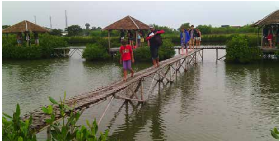
Potensi pengembangan ekowisata dan edukasi hutan mangrove Sawah Luhur, sudah mulai nampak dengan berbagai kunjungan turis lokal dan asing

Seiring waktu, kegiatan rehabilitasi kawasan terus menunjukkan hasil yang baik, kawasan nampak mulai rindang dan hijau oleh tanaman mangrove, di sisi lain masyarakat petambak mulai merasakan dan menikmati hasil usaha budidaya bandeng mereka. Kawasan pesisir termasuk masyarakat sekitar harus terus diperkuat, dan pada tahun 2012, WII bersama mitra kerja yang lain mencoba menerapkan kegiatan restorasi kawasan melalui teknik inovatif pemerangkap sedimen ( hybrid engineering ). Hasilnya saat ini di depan sebelah utara kawasan CPAD tampak terbentuknya hamparan lumpur/daratan baru yang telah ditumbuhi jenis-jenis tanaman mangrove secara alami. Hal ini tentu menjadi kekuatan baru bagi perlindungan kawasan konservasi, dan bahkan bisa menjadi tambahan luasan kawasan CAPD.