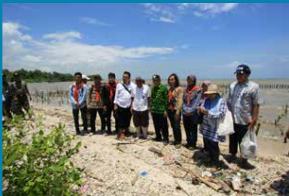
Foto bersama dengan tim pengamat burung di depan lokasi pemerangkap sedimen