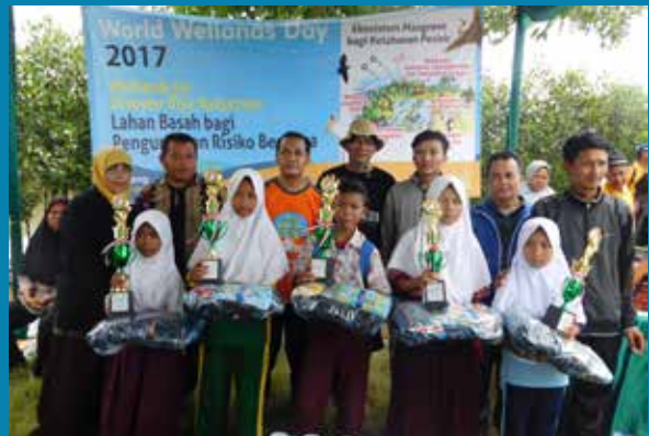
Pembagian trophy dan hadiah bagi siswa/i SD pemenang lomba gambar