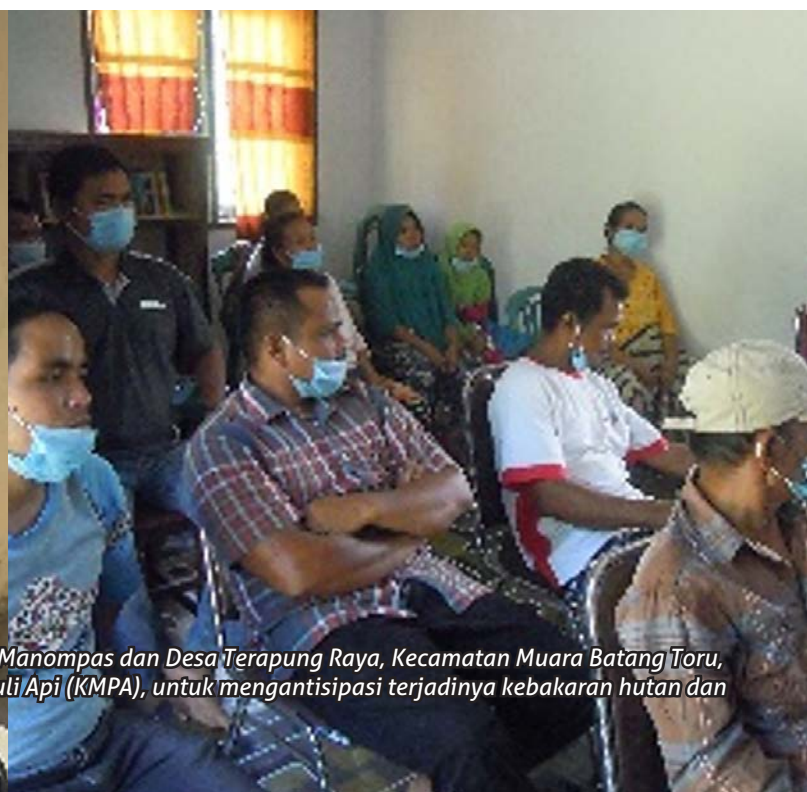
Kelompok masyarakat dampingan YLBA dari Kelurahan Muara Manompas dan Desa Terapung Raya, Kecamatan Muara Batang Toru, dengan penuh antusias membentuk Kelompok Masyarakat Peduli Api (KMPA), untuk mengantisipasi terjadinya kebakaran hutan dan lahan di wilayah mereka.