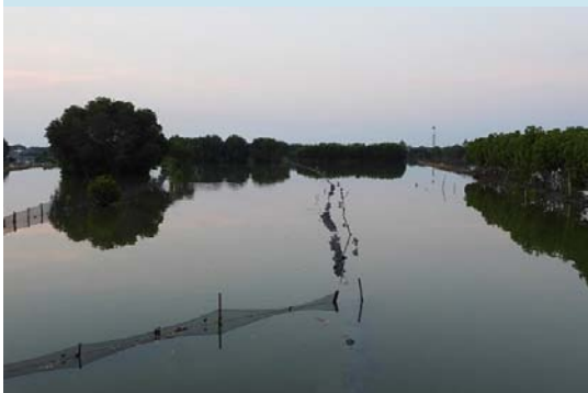
Hamparan tambak di Desa Morodemak dengan pembatas waring yang hampir seluruhnya terendam.