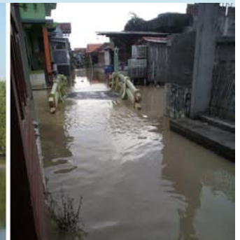
Hamparan tambak di Desa Tambakbulusan yang terdampak rob, dimana tanggul-tanggul pembatas tambak sudah tidak terlihat lagi (kiri & tengah); dan rumah warga yang tergenang rob dengan ketinggian rata-rata 30 cm (kanan).