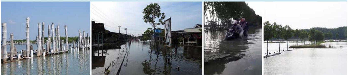
Struktur HE di Desa Timbulloko mengalami kerusakan cukup parah, tali-tali pengikat sebagian lepas dan mengendor (kiri); akses jalan kampung terendam (tengah); dan tambak warga yang masih tenggelam pasca diterjang rob di awal bulan Juni 2020 (kanan)