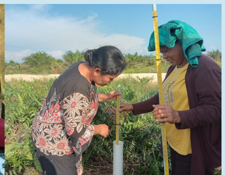
Praktek dan aplikasi di lapangan, merupakan bagian dari kegiatan pelatihan (ToT)