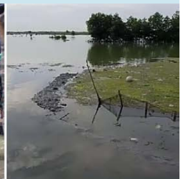
Desa Wedung yang selama ini tidak pernah tergenang rob tahun ini turut terendam (kiri & tengah). Ketinggian rob yang melebihi ketinggian tanggul pembatas mengakibatkan bandeng dan udang yang siap panen hilang dan petambak mengalami gagal panen (kanan).