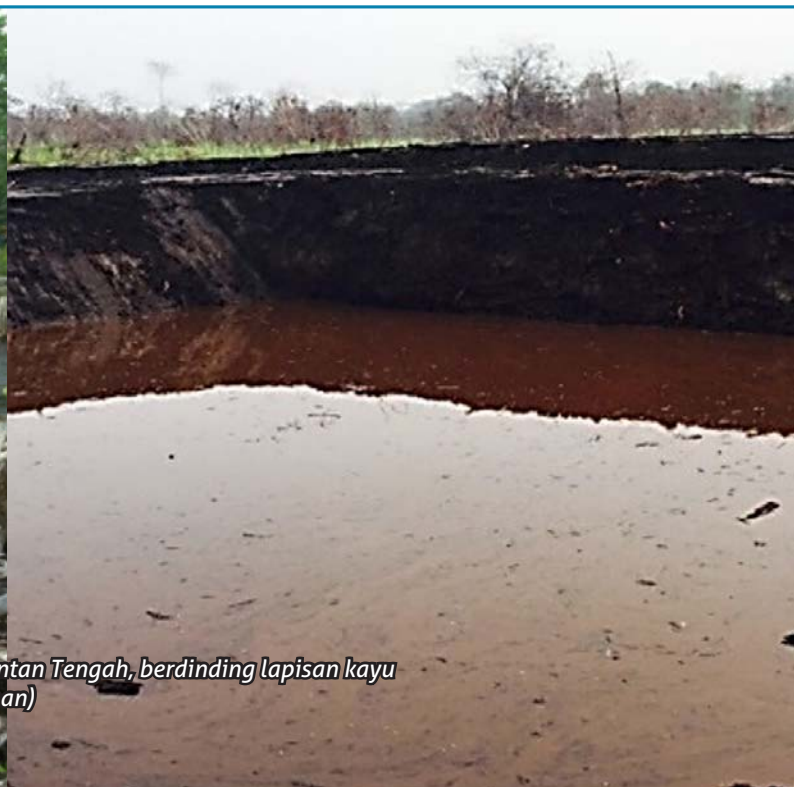
Embung yang dibangun di lahan gambut, Tumbang Nusa, Kalimantan Tengah, berdinding lapisan kayu (kiri; Foto: I Nyoman S.P., 2013); dan Embung tanpa pelapis (Kanan)