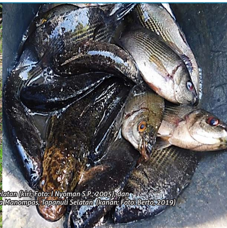
Kolam Beje di lahan gambut Desa Muara Sungai Puning, Barito Selatan (kiri; Foto: I Nyoman S.P., 2005); dan ikan-ikan yang dijumpai di kanal-kanal lahan gambut Desa Muara Manompas, Tapanuli Selatan (kanan; Foto: Berto, 2019)