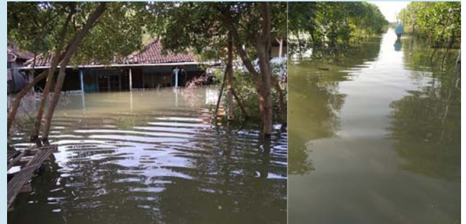
Kondisi permukiman warga Dukuh Bedono yang terendam air rob.