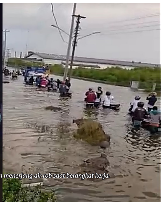
Aktivitas warga yang terganggu akibat rob (menggunakan sampan, dan berjalan menerjang air rob saat berangkat kerja).