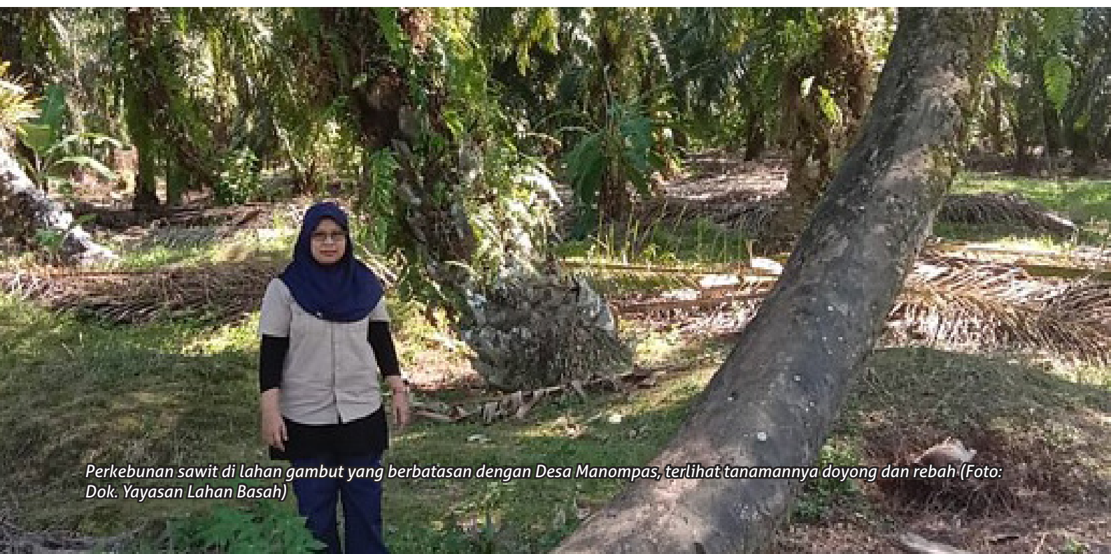
Perkebunan sawit di lahan gambut yang berbatasan dengan Desa Manompas, terlihat tanamannya doyong dan rebah

menarik perhatian bagi siapa saja yang melihatnya, yaitu kondisi tanaman sawit yang hampir sebagian besar dalam kondisi doyong seperti yang hendak roboh atau tercerabut. Lalu apa penyebab itu semua? Seperti yang dikatakan fasilitator YLBA yang bertugas di Tapanuli Selatan, bahwa tanah yang ditanami oleh sawit tersebut adalah tanah sobu-sobu, atau tanah gambut, tanah yang basah, yang sebenarnya tidak tepat untuk ditanami sawit yang memerlukan media tanam kering. Oleh karena sifat tanaman sawit yang memerlukan tanah kering, akhirnya dibuatlah sodetan-sodetan saluran (kanal) di gambut, sehingga permukaan gambut menjadi kering. Karena itulah tanaman sawit di gambut tidak kokoh tegak mudah terdorong angin lalu rebah, dan akhirnya menjadi tidak produktif.