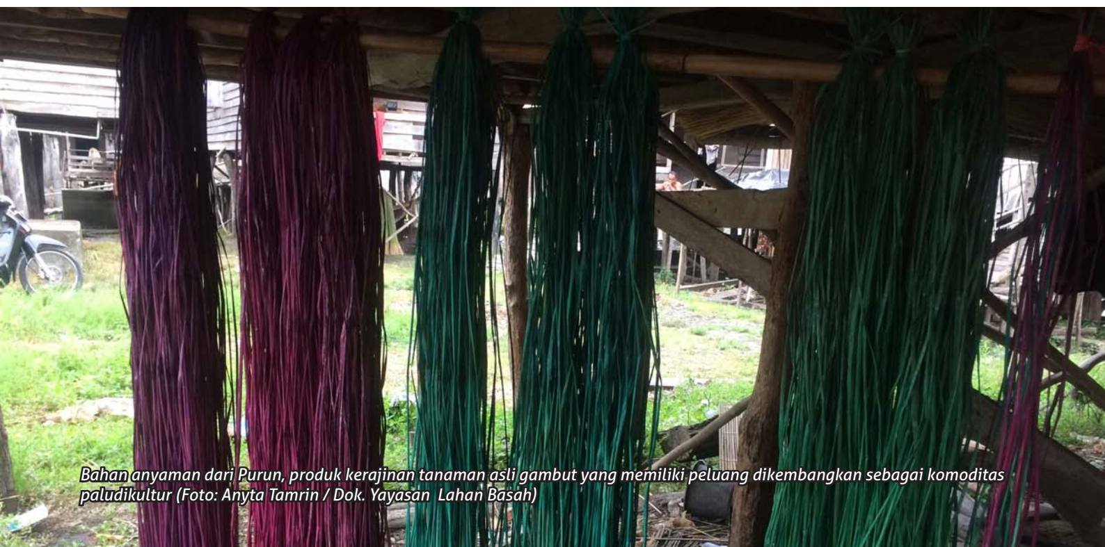
Bahan anyaman dari Purun, produk kerajinan tanaman asli gambut yang memiliki peluang dikembangkan sebagai komoditas paludikultur

(Dilaporkan oleh: Susan Lusiana, Yayasan Lahan Basah)