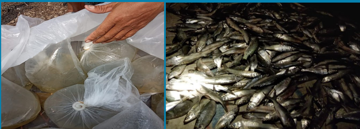
Bibit ikan bandeng/ nener (kiri); dan ikan bandeng yang sudah dipanen (kanan).