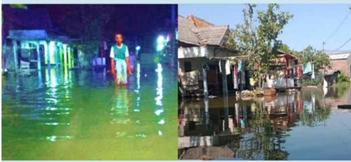
Kondisi permukiman warga Desa Tugu akibat tergenang rob.