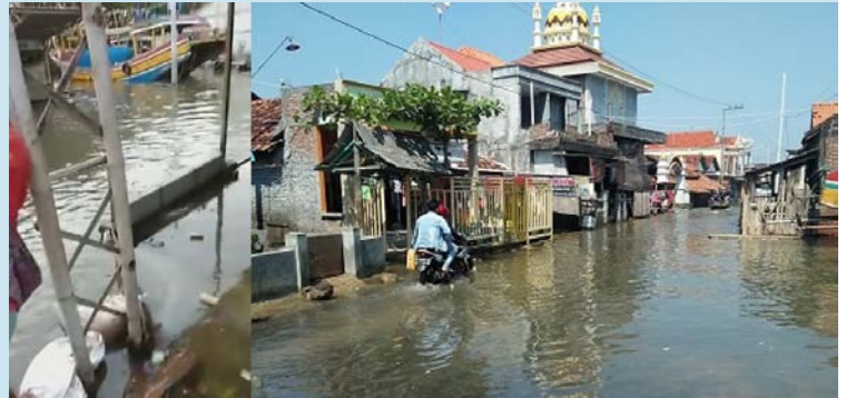
Sungai di Desa Purworejo tidak dapat menampung limbah rob yang menerjang pada awal Juni 2020 (kiri). Akses jalan utama Desa Purworejo yang tergenang rob (kanan).