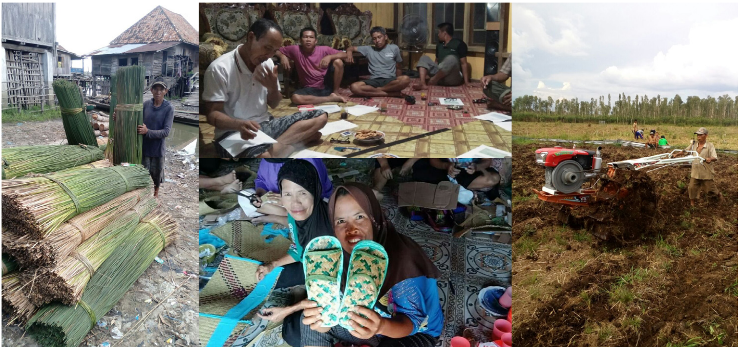
Kegiatan panen purun oleh Purun Institute, sosialisasi hutan desa oleh Yayasan Puter, pembuatan sumur bor oleh Yayasan Petak Danum dan pertanian rawa padi tanpa bakar oleh KUD Sebangau (kiri ke kanan)

Melalui kegiatan pertanian terpadu ini diharapkan kegiatan-kegiatan peningkatan ekonomi masyarakat yang sekaligus dapat memperbaiki ekosistem lahan gambut dapat dilakukan secara berkelanjutan dan menjadi contoh bagi masyarakat di desa lainnya.