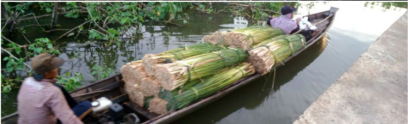
Kegiatan pelatihan revegetasi lahan basah oleh APBS Kalimantan Barat, Pembuatan sumur bor oleh Yayasan Petak Danum, Kalimantan Tengah dan pengangkutan purun dengan perahu yang dihibahkan kepada kelompok masyarakat oleh Purun Insitute. (kiri ke kanan)